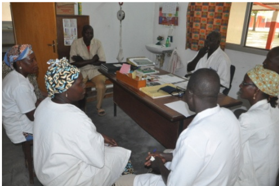
Réunion de concertation des équipes