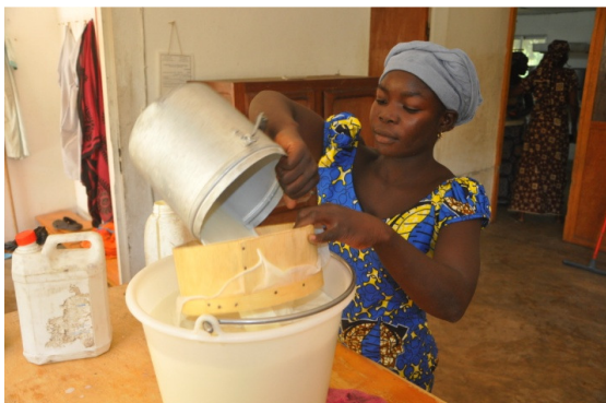
Réception du lait (environ 100 litres par jour)