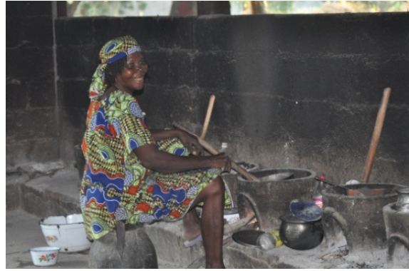
Cuisine de l'hôpital