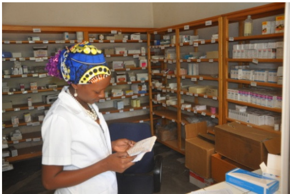
Pharmacie de distribution avant