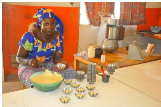
Préparation des muffins à la boulangerie