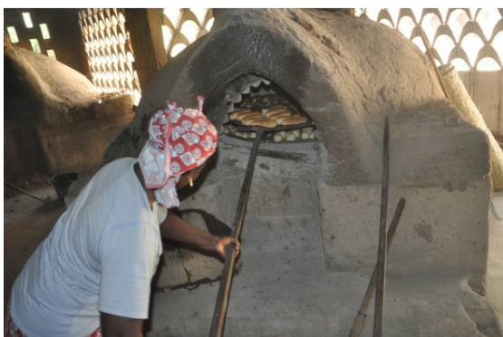
Sortie du four