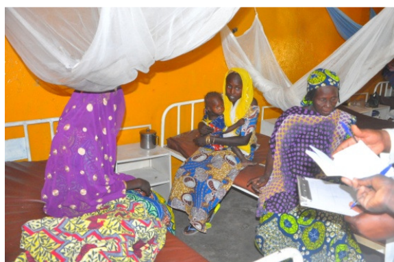
Chambre d'hospitalisation avec 4 lits