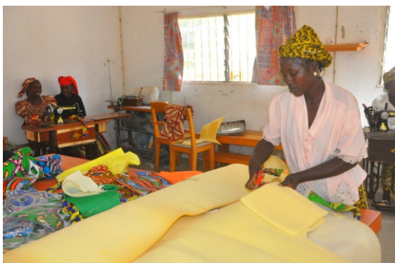
Coupe de la mousse pou rembourrage