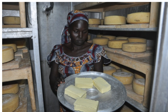
Chambre froide, maturation des fromages, stockage du beurre fabriqué