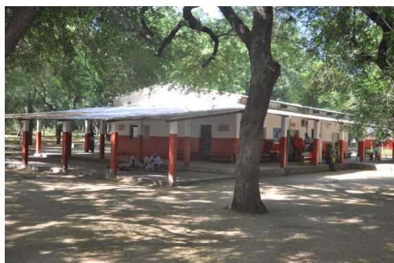
Bâtiment d'accueil, caisse, consultation